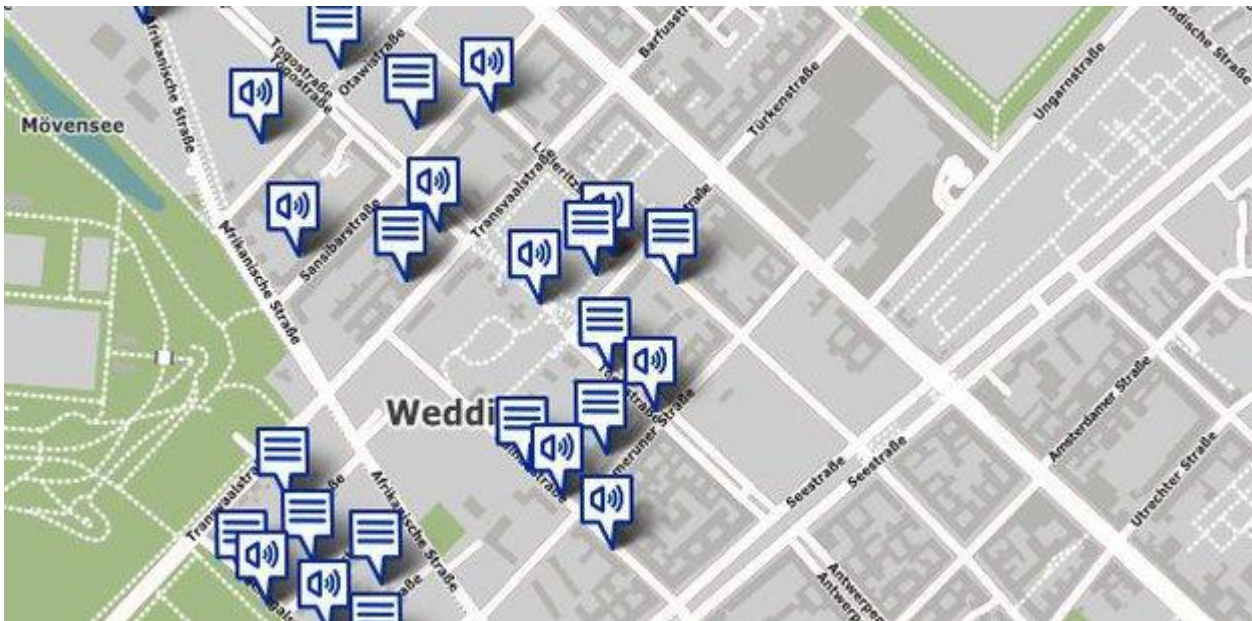
Die koloniale Vergangenheit: oft verleugnet und vergessen, im Wedding nun mit einem Klick abrufbar.

Ein interaktiver Stadtplan macht die Geschichte des Afrikanischen Viertels und dessen koloniale Vergangenheit sichtbar.