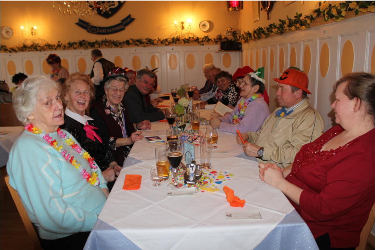
Ohne die Landsleute aus dem Kreis Schlochau könnte die Kulturveranstaltung nicht stattfinden!