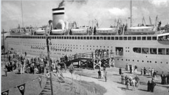
Das Schiff "Seedienst Ostpreußen"