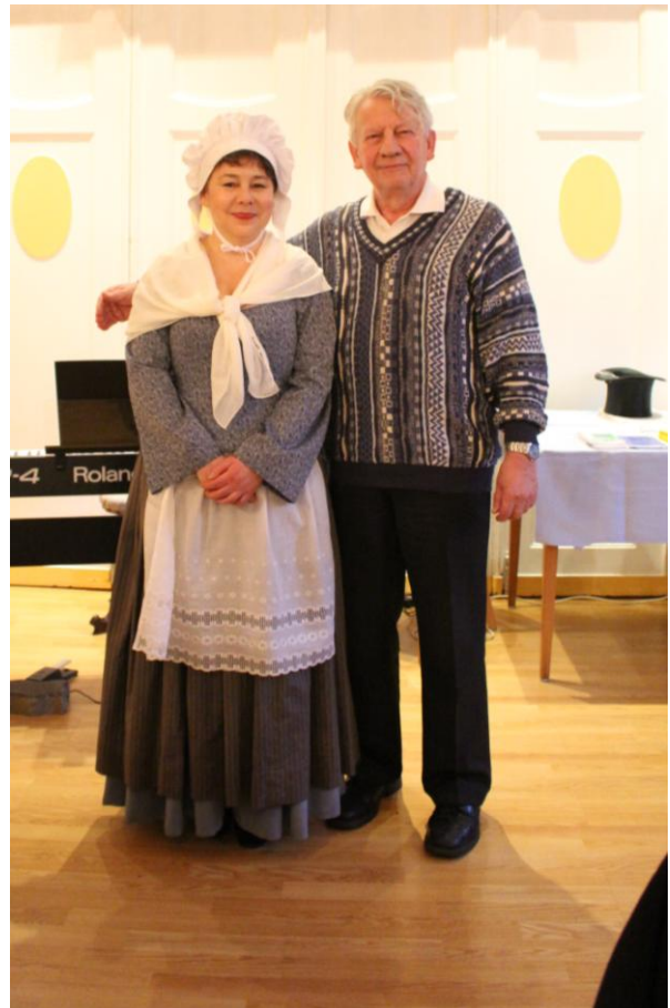
und mit Westpreußen-Chef