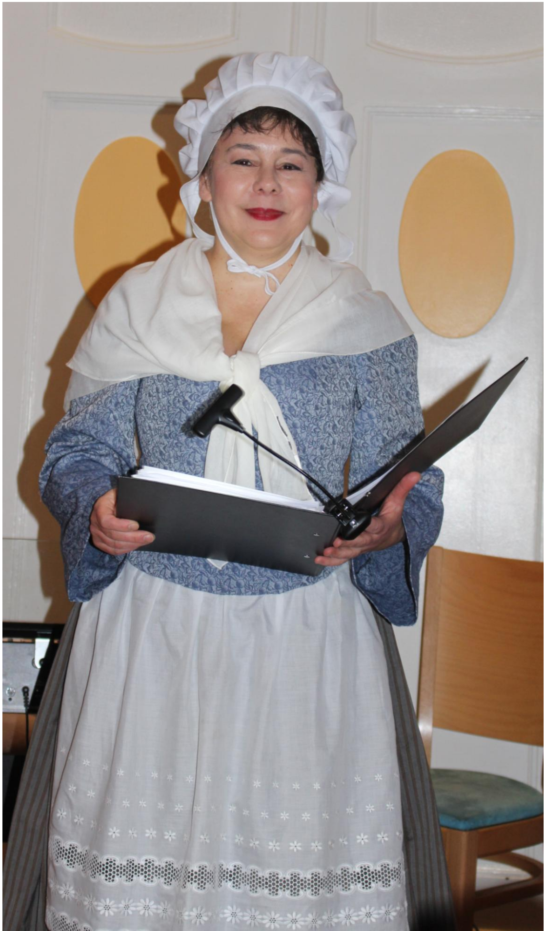
Auf Wiedersehen am 11. Februar 2018 – wer kann da widerstehen?