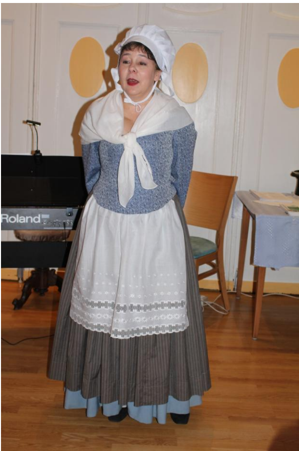
Die Künstlerin ohne