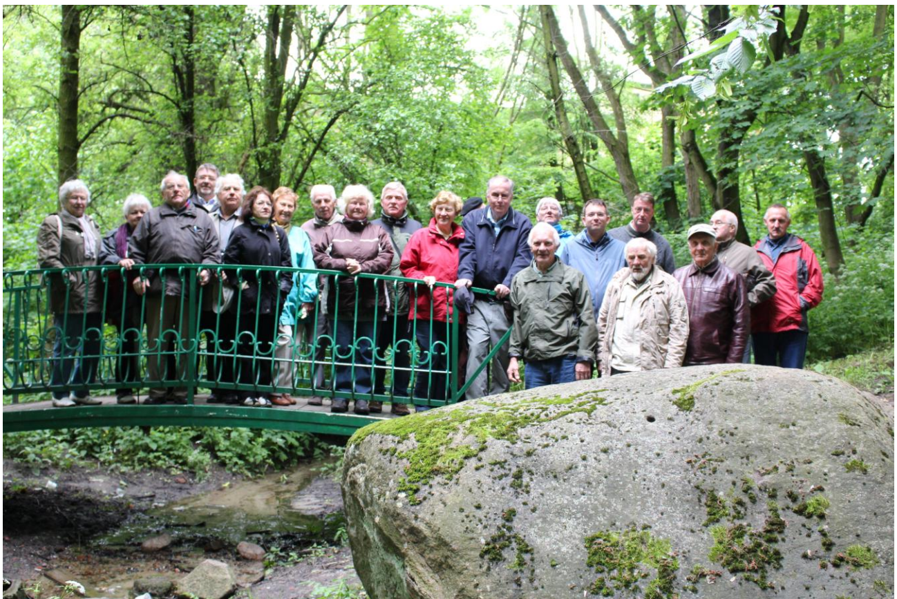
Teilnehmer der "22. Weißenhöher Himmelfahrt" am 29.05.2014 am Flottwell-Stein in Weißenhöhe: Zeugnis der Eiszeit.

Doch wir alle wussten: "Jedes Jahr ist Weißenhöher Himmelfahrt!"