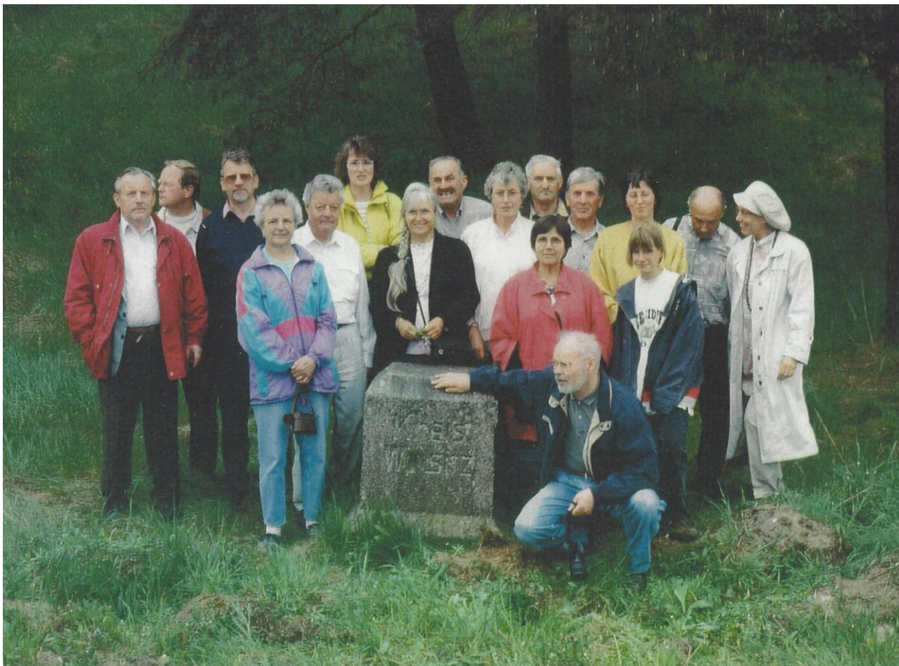
Das Gruppenfoto von 1996 am Wirsitz-Stein

Im nahen Veronika beeindruckten erneut die im letzten Weltkrieg modern und großzügig errichteten Ersatzbauten der Wirtschaft-Wohn-Gehöfte im Ziegel-Fachwerk-Stil mit Vorlaube. Ein Teilnehmer konnte sich noch sehr gut an ihren Neuaufbau sowie an die Faszination, die damals davon ausging, erinnern.