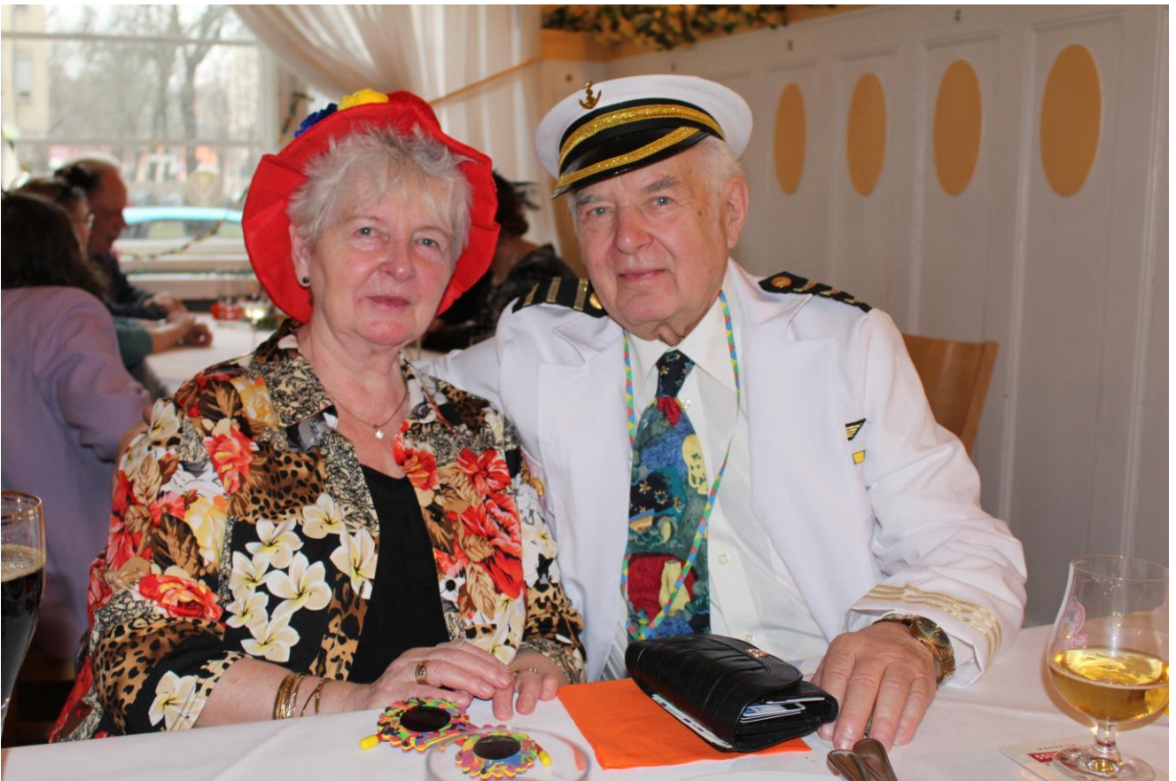
Das Ehepaar Förster aus dem Kreise Schlochau preisverdächtig